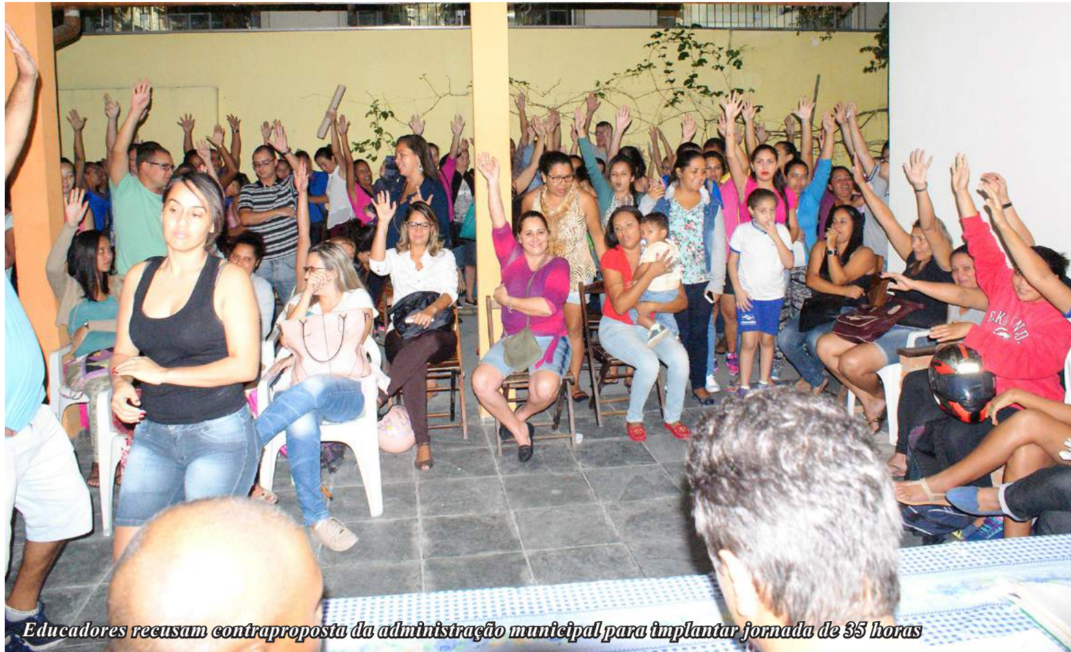
Educadores recusam contraproposta da administração municipal para implantar jornada de 35 horas

Os educadores de creche volta a se reunir em assembleia, para deliberar sobre a contraproposta da administração municipal, em conceder 35 horas de labor, após negar a implantação do pagamento do adicional de penosidade aos trabalhadores. A oferta da administração ocorreu após assembleia da categoria, ocorrida no dia 08 de março, onde ficou decidido a série de pro-