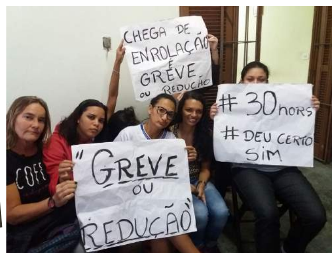
Nas redes sociais categoria segue organizada e firme no propósito das negociações, que se arrastam desde 2014.

de trabalhar com a jornada de 30 horas nas unidades.