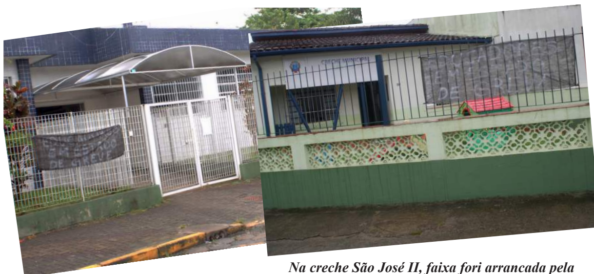
Em protesto, categoria realizou paralisação podendo deflagrar a greve