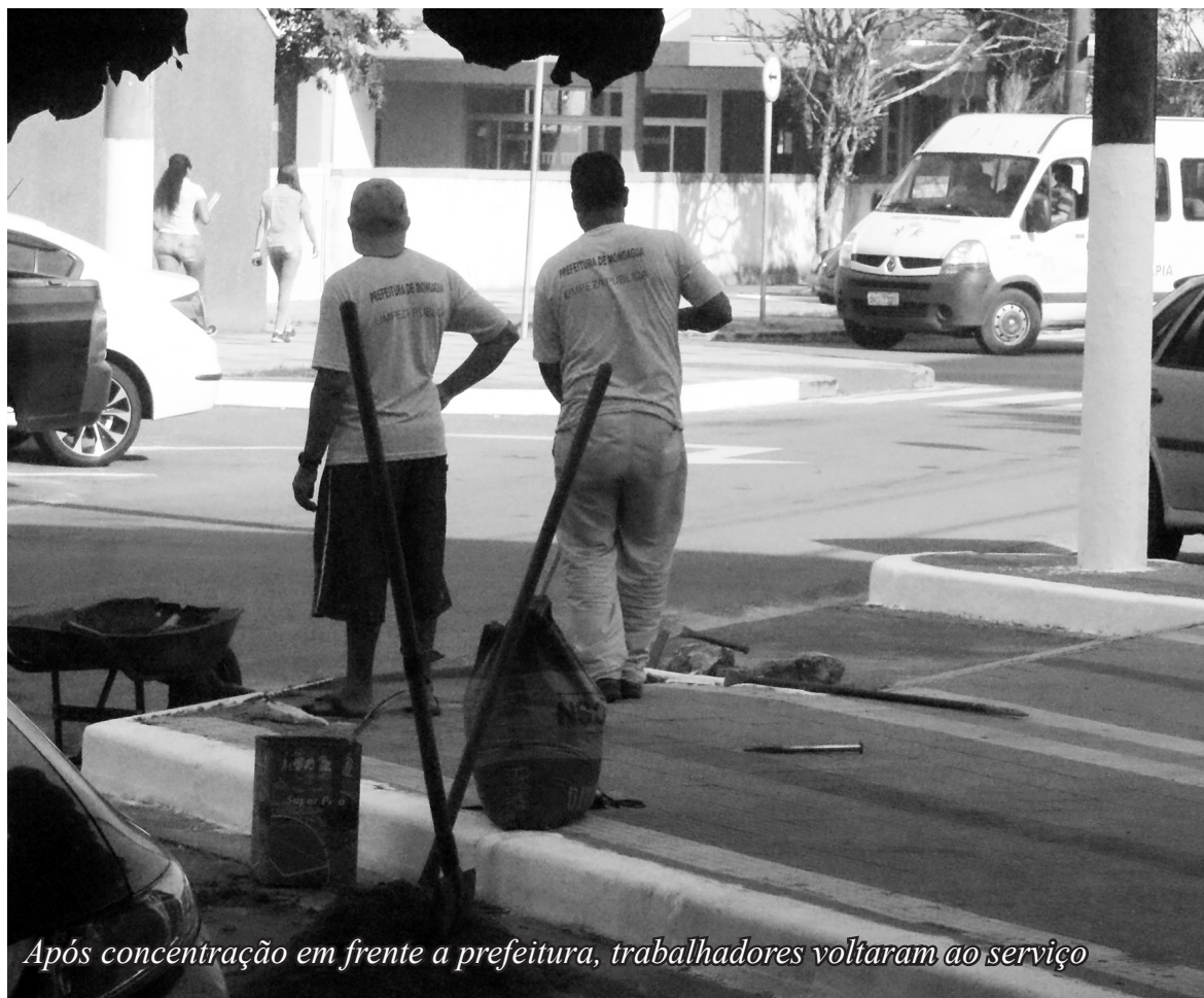
Após concentração em frente a prefeitura, trabalhadores voltaram ao serviço

Os servidores que atuam na garagem municipal do Jussara, em Mongaguá, realizaram protesto na manhã do dia 14 de fevereiro, no paço municipal, após serem dispensados do serviço por falta de uso do Equipamento de Proteção Individual (EPI). Os trabalhadores afirmaram que a administração municipal, não havia realizado a entrega dos equipamentos.